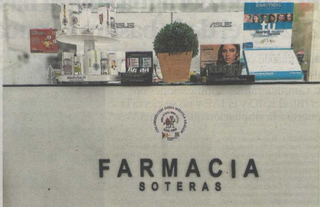
Los establecimientos colaboradores son obsequiados con la pegatina de Dona Médula Aragón.

Este sábado día 16, desde las 10.00 hasta las 20.00, estaremos en la plaza del Pilar, celebrando de un modo muy especial el Día Mundial del Donante de Médula Ósea y de Sangre de Cordón Umbilical. Junto a la Unidad Militar de