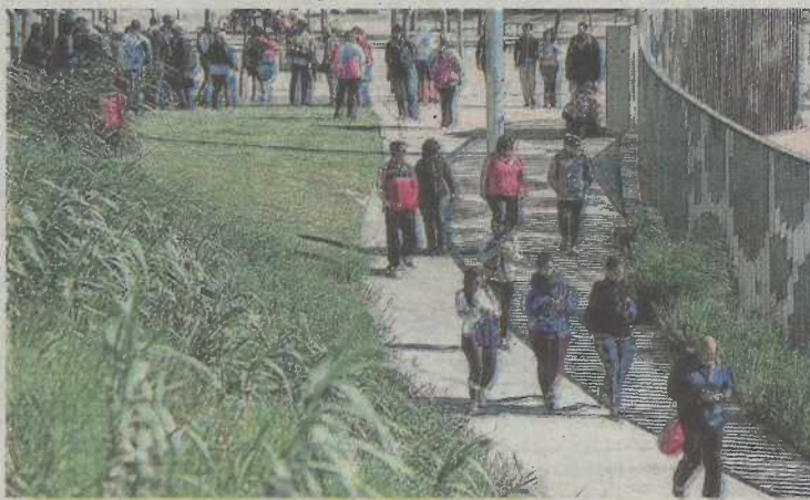
Imagen de una edición anterior de la andada.

Además, también se ha seleccionado la iniciativa 'Conhogarismo', de la Fundación San Blas, que proporciona herramientas a las personas sin hogar, residentes en Zaragoza, para que superen la limitación de la falta de recursos; y el proyecto de 'Acisjv in vía', que permite mejorar la calidad de vida de las personas que participan a través de talleres individuales y